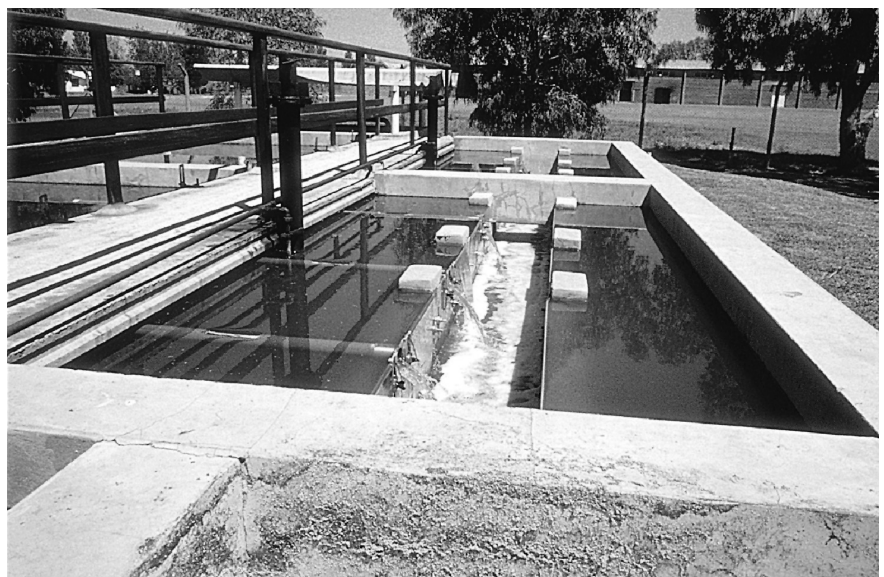
Foto 2. Planta de tratamiento de efluentes de de una curtiembre de Buenos Aires.