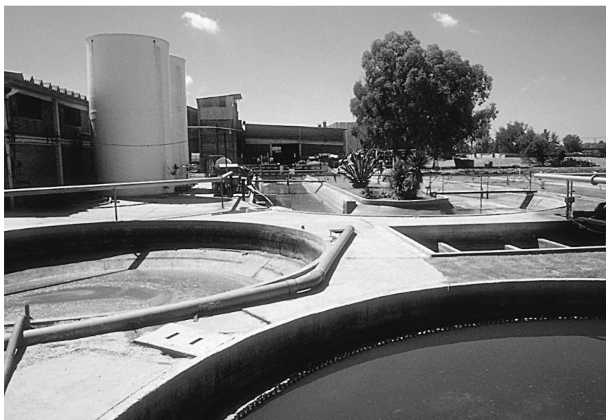
Foto 1. Planta de tratamiento de efluentes de una curtiembre de Buenos Aires.

Se deben emplear más eficientemente los recursos reduciendo la contaminación, y de-