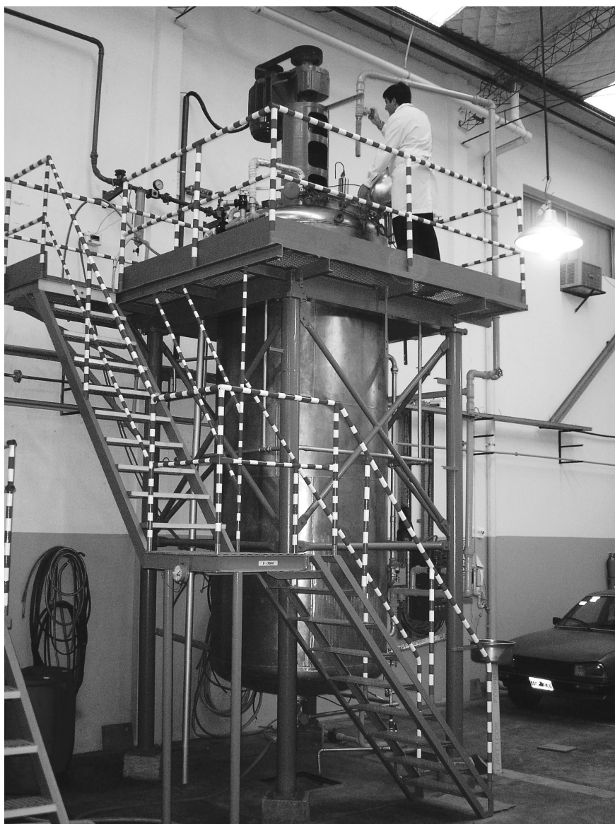
Foto 3 Planta de producción de enzimas por fermentación, en el gran Buenos Aires.

A nivel de investigación, aparecen trabajos sobre pinturas en polvo para cueros, resinas que no requieren reticulantes externos, etc. [7], o modificación de acrílicos aplicando nanotecnología.