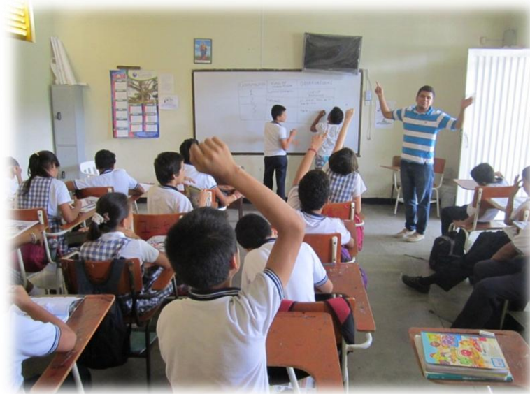
Imagen 3. Aplicación de la planeación de clase.

Para el cuarto momento, el cual concierne con la aplicación de la planeación realizada, el profesor de Didáctica II observa, toma referentes fotográficos y filma el desarrollo de la clase realizada por el estudiante profesor de VII semestre, para luego reflexionar el resultado de la planeación (Ver Imagen 3).